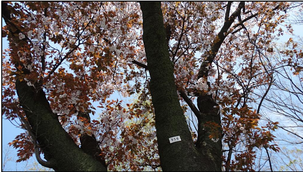
古木 No956 満開