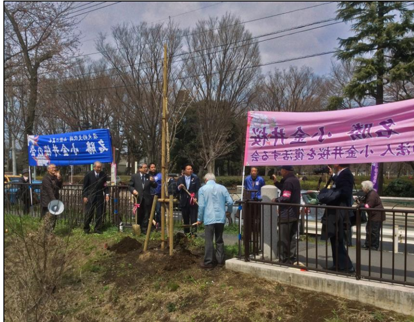
平右衛門桜 記念植樹式

発行：事務局 植竹 Hp http://koganeizakura.com 〒184-0004 小金井市本町 4-19-8