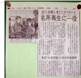
岩瀬小の掲示板に張られた新聞の切り抜き