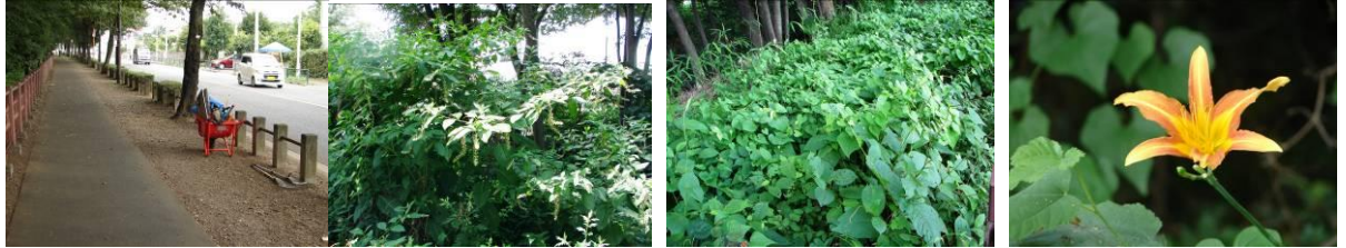
ヨウシュヤマゴボウ ミズヒキソウとヤマイモのツル ノカンゾウ

第2ブロック左岸の桜樹は緑道の剪定のついでにされたのか、ヒコバエや幹から出た小枝が剪定されていた(左岸)。近隣の住民の方々が植えオシロイバナやタチアオイがとても美しかったが、それに引き換え、柵内はヨウシュヤマゴボウが巨大に生長していたり、ミズヒキソウにヤマイモが絡み付いて繁っていたり、夏草が勝手気ままに繁殖しているのがとても対照的だった。ノカンゾウが綺麗だった。