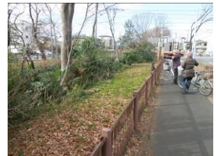
さっぱりした茜屋橋下流風景