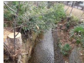
茜屋橋周辺の雑木の切り株