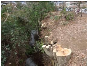
貫井橋周辺の雑木の切り株