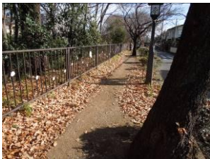
落葉の積もった上水緑道

2012年最後の桜パトロール。風は冷たいが好天に恵まれ、絶好のパトロール日和。張り切って最初の1本を見たら、何と番号札が見当たらない。先月から枝木の伐採等が始められているので枝と共に取り去られたのかもしれない。本日は番号札の確認も忘れまいと話し合う。上水は殆んど裸木となり、右岸も左岸も落葉が重なり合っていた。中に紅葉の色あせた木があり、より冬を感じさせた。茜屋橋周辺の上・下流、及び貫井橋周辺の上流の雑木(前回パトロール時に赤テープがまかれていた木々)が伐られていた。貫井橋下流はまだ手付かずだった。