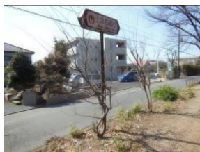
ケヤキの幼木たち

右岸に綺麗に清掃された緑道にケヤキの幼木が3本並んでいた。恐らく種が落ちたものが育ったのだろうが将来が不安だ。オオイヌノフグリやヒメオドリコソウが咲き始めた。