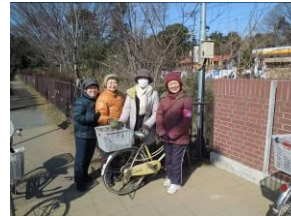
パトロール前小金井橋で記念撮影