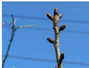
No.273 (オオシマ系) No.227