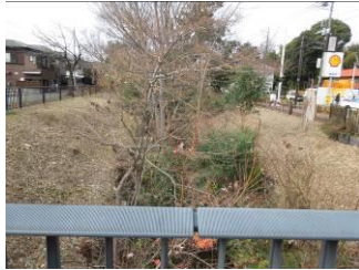
小金井橋より西方面

12月に入って右岸(南岸)の木々の伐採・枝落しが一挙に進み、下草も刈られ見違えるばかりに明るくなった(数本取り残しの青テープが見える)。右岸(南岸)→上水→左岸(北岸)の透けて見える部分が多くなった。左岸は11月に殆んど整備されたが、貫井橋~小金井橋の一部に市未整備分はそのまま取り残されている(青・赤テープ十数本そのまま)。上水整備工事内容とスケジュール看板が増えた。又新に補植工事看板が掲げられた。