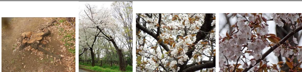
2013-12-17 現在切株 2012-4-13 No.946 全体写真と開花写真 2013-3-30 No.946 開花写真