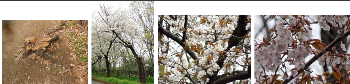
2013-12-17 現在切株 2012-4-13 No.946 全体写真と開花写真 2013-3-30 No.946 開花写真