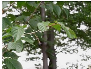
KS10(ヤマザクラ小金井)

第2ブロックに今年の2月補植されたKS番号の若木KS10とKS13に可愛い実がついていた。