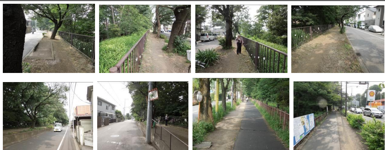
小金井橋の北西に下記の看板が見られた。