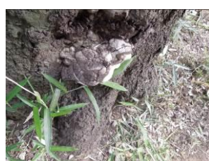
No.955 のコフキサルノコシカケ