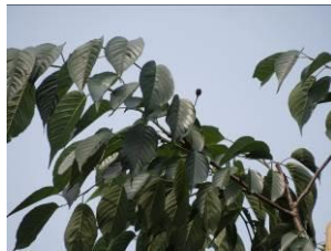
KS13(ヤマザクラ小金井)