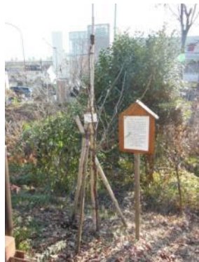
N62 小金井橋記念樹(北上)