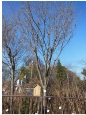
S41 小金井橋記念樹(桜川) 立て看板の文字消え