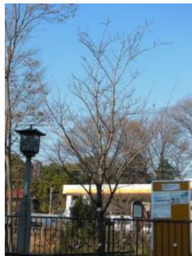
S42 小金井橋記念樹(小金井)