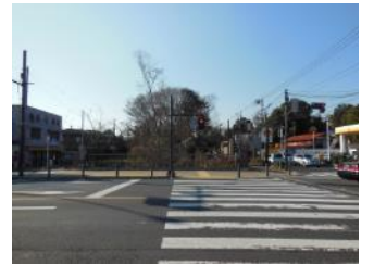
小金井橋から見る東(左)・西(右)