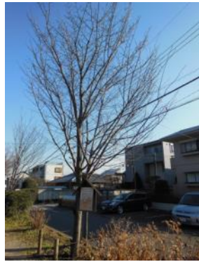
S40 里帰り桜(北上) 立て看板が見えにくい