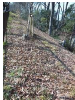
KS 18 東から