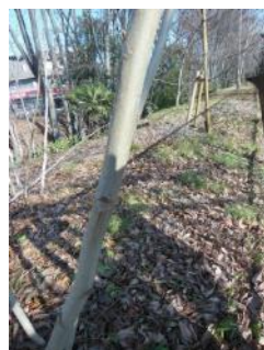
KS 17 西から