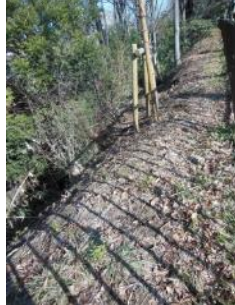
KS 14 西から