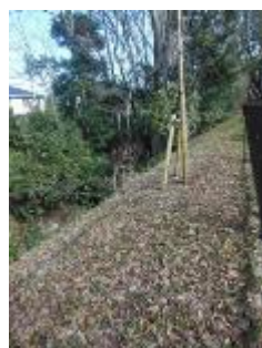
KS 10 西から