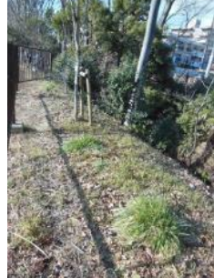
KS 15 東から