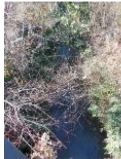
小金井橋西側上水