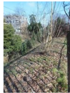
KS 13 西から