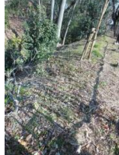
KS 15 西から