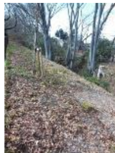
KS 9 東から