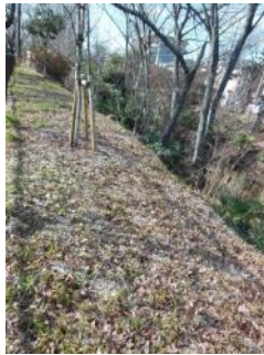
KS 12 東から