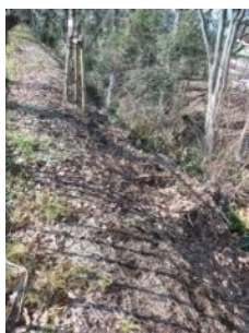
KS 14 東から(法面狭し)