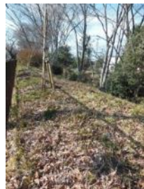
S 17 東から(西 3m青桐有)