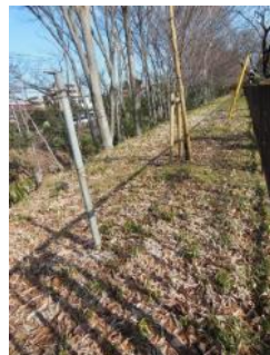
KS 19 西から