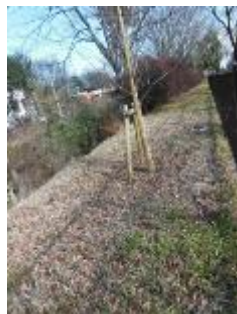
KS 8 西から