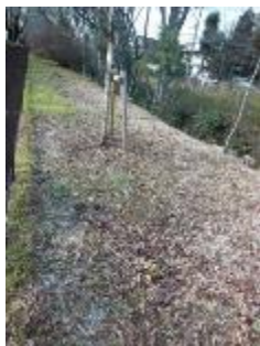
KS 8 東から