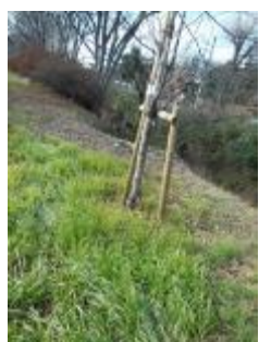
KS 7 東から見る

2014年2月に補植された幼木たちは冬日の中で固い蕾を守っていた。下草が枯れ周りの状況が良く見えるので現状写真を撮った。KS7は東からの1枚のみだがKS8以降は若木の東西から撮った。KS11の南の緑道には若いケヤキが2本有り、丁寧に添え木までされている。可哀そうだがこのケヤキはアツという間に大きく育つので今のうちに伐採して戴かないと、KS11は日当たり不良に陥りそうだ。KS13の東に枯れ枝が片付けられないまま放置されているが、キノコがビッシリついてる。撤去して頂けると助かる。KS13は1m西に青桐らしい若木が有り、KS17の3m西には更に大きい青桐らしい若木がみられる。なんとか善処をお願いしたい。