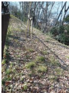
KS 19 東から