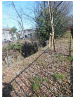
KS 12 西から