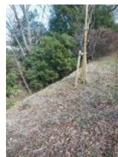
KS 11 西から