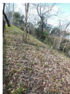
KS 20 東から