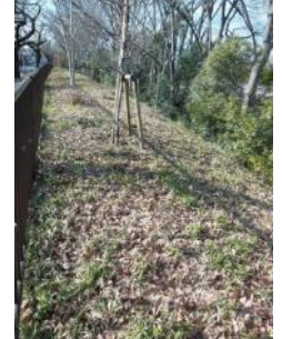
KS 16 東から