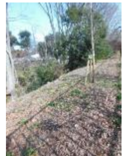
KS 9 西から