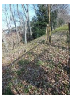
KS 20 西から