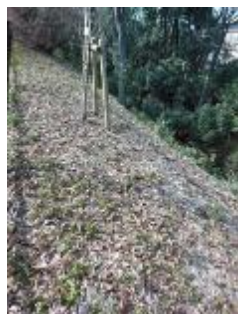
KS 10 東から