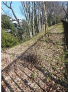
KS 16 西から