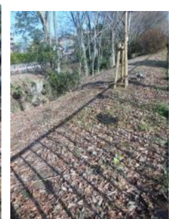
KS 18 西から