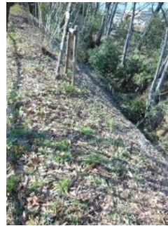
KS 13 東から