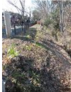
小金井橋西側土手

冬枯れで木立も道もさっぱりして青空が美しかった。1月に新たに伐採された木の切り株の色が清々しかった。柵内だけでなく、桜樹のヒコバエや下枝が全てではないが、所々剪定され、危ない枯枝の伐採が行われた箇所も見受けられた。太い切り口には腐朽菌対策の薬も塗られていた。感謝。ただ、以前整然と刈られた上水の小さな雑木たちがまた成長して、上水を覆ってしまい、橋から見ると上水が見えにくくなって来た。灌木の伐採もまたお願いしたい。