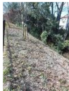
KS 11 東から