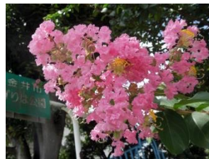
沿道のサルスベリ