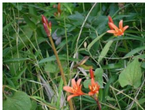
キツネノカミソリかな?