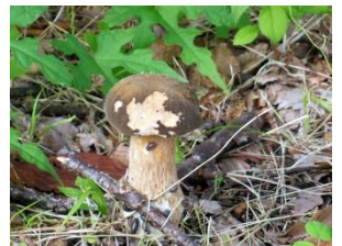
左岸柵内のキノコ