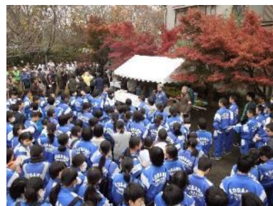
2014年落ち葉回収作戦開会式