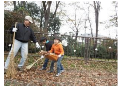
可愛い子供さんも一緒に