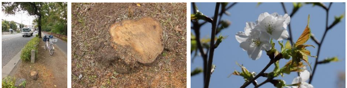
No.190(カスミザクラ) 2015年10月切株になる

9月のパトロールで枯死では？と報告した No.190 が伐採されて切株になっていた。前回ヤマザクラと誤記してしまったが、正しくはカスミザクラです。No.225 も伐採されて切株になった。