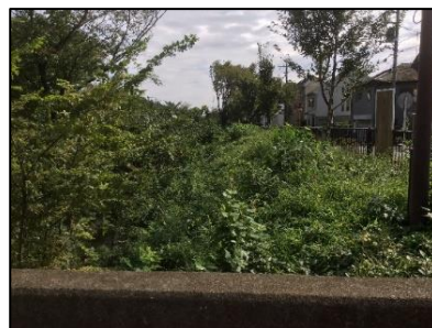
新小金井橋下流右岸