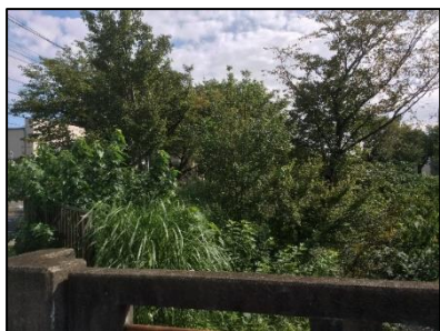
新小金井橋下流左岸