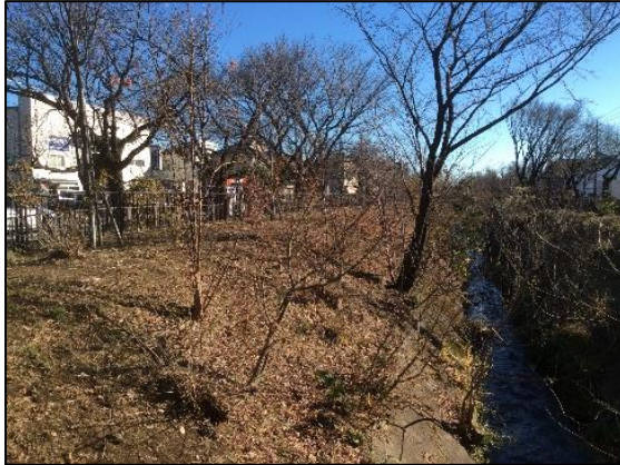
新小金井橋下流右岸