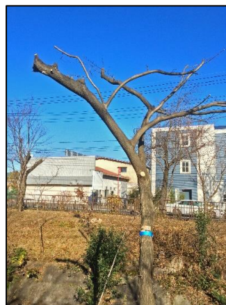
右岸青テープ付雑木