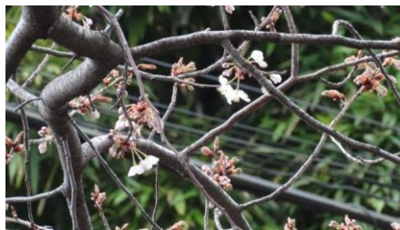
No. 936 ヤマザクラ (開花)