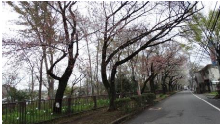
茜屋橋より右岸東を撮る

本日は昨日に引き続き小金井公園での桜まつりで、孫たちがやってきた。右岸を案内がてら開花パトロールをする。孫と一緒にだったので右岸のみで、左岸の開花パトロールはなし。ヤマザクラのみ8本の開花。曇天で本日も綺麗な写真なし。