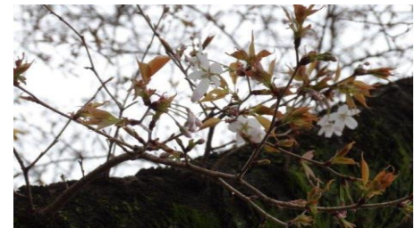
No. 891 ヤマザクラ (開花)