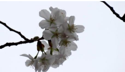
No. 882 ヤマザクラ (開花)