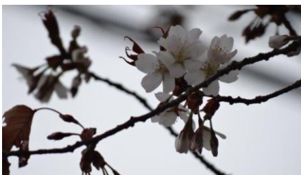
No. 896 ヤマザクラ (開花)