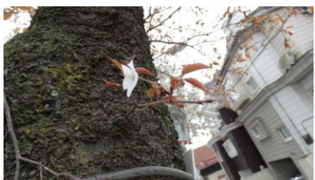
No. 904 ヤマザクラ (開花)