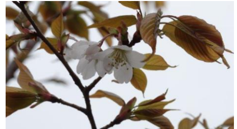
KS12 ヤマザクラ (開花)