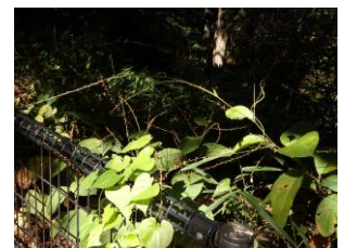
マルバルコウソウ