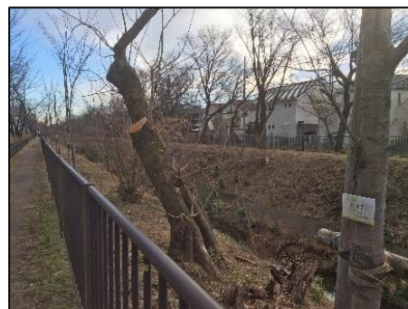
伐採処置不良 #386 伐採