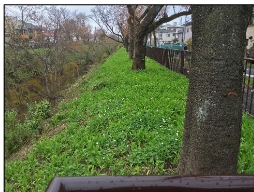
イチリンソウ他、下草が美しい