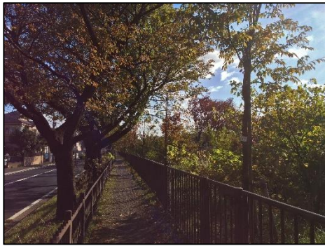
N17 付近；紅葉、雑木繁茂

左岸；342(加ミザク)枯死。356(オヤマザク)、363、371、372 弱体。380(加ミザク) 枯死のまま。399(加ミザク)弱体。 全域に雑木繁茂