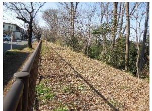
貫井橋~茜屋橋(右岸)