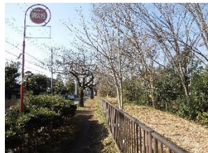
貫井橋~茜屋橋(右岸)