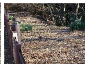
茜屋橋~貫井橋(左岸)