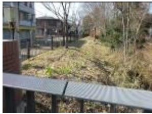
小金井橋右岸柵内

1、全体 冬枯れの玉川上水は寒かった。花も少なく寂しいが、柵内の下草が処理されていてさっぱりと気持ちの良い風景であった。左岸の水仙の近くでキジバトが2羽餌をついばんでいた。