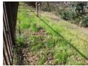
小金井橋~貫井橋(右岸)