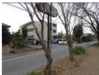
KS11 の南側、緑道端の若いケヤキ3本