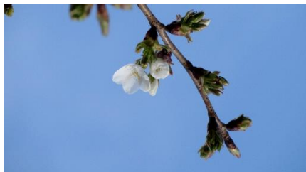
No. 273 (オオシマ系) 開花