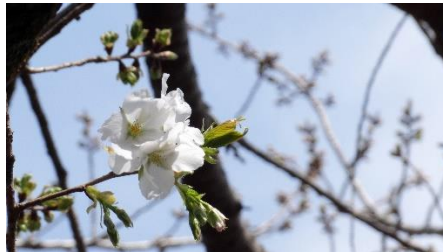
No. 880 3 輪開花 (3/24)