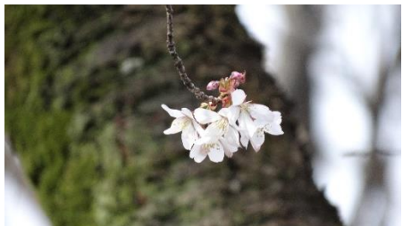
No. 915 (ヤマザクラ) 開花 (3/27)