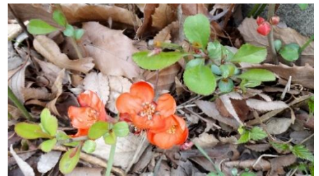
草ボケ (シドメ) 開花 (3/24)