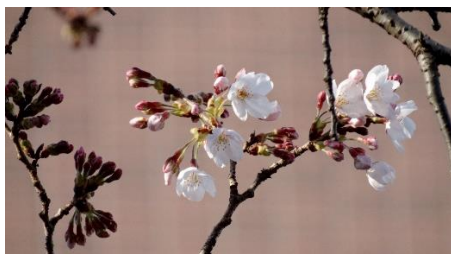
No. 222 (ソメイヨシノ) 開花