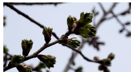
No. 273 (オオシマ系) 3/24 のつぼみ