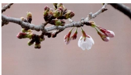
No. 222 (ソメイヨシノ) 開花寸前 (3/24)