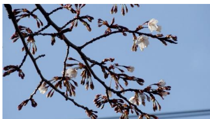
No. 271-1 (樹種不明) 開花