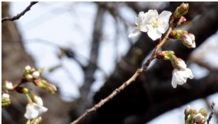
No. 199 (ソメイヨシノ) 開花 3 日目