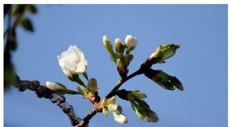
No. 271 (オオシマ系) 開花