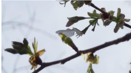
一枚になった No. 880 (3/27)

No. 880 が 3/24 に 3 輪開花したが、連日の雨と風で本日は開花はおろか咲いていた花まで風に吹き飛ばされて一片の花びらと化していた。No. 217 (オオシマ系) はあつという間に梢まで花盛り。No. 222 が開花したので、第2ブロックのソメイヨシノ 3 本はすべて開花終了。ヤマザクラ 1 本、オオシマ系 4 本。計 8 本の開花となった。ヤマザクラの赤芽が美しい。