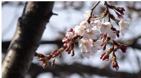
No. 952 (ソメイヨシノ) 開花 3 日目