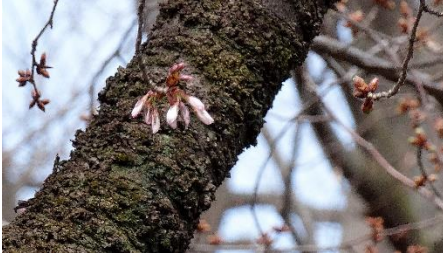
No. 915 開花寸前 (3/24)