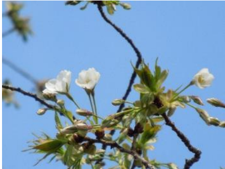
No. 244 (オオシマ系) 開花