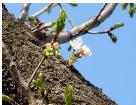
No. 189 (オオシマ系) 開花