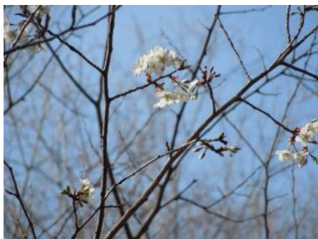
No. 927 (ヤマザクラ) 開花