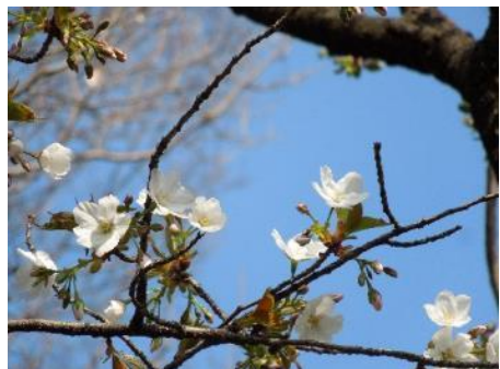
No. 941 (オオシマ系) 開花