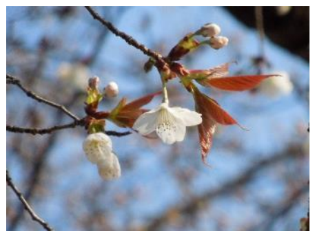
No. 898 (ヤマザクラ) 開花