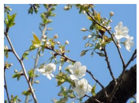
No. 953 (オオシマ系) 開花