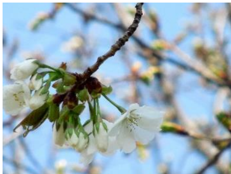
No. 191 (ヤマザクラ) 開花