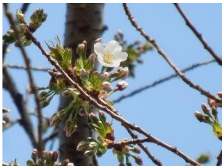
No. 947 (ヤマザクラ) 開花