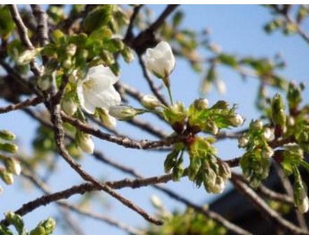
No. 903 (オオシマ系) 開花