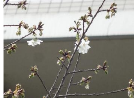
No. 224 (オオシマ系) 開花