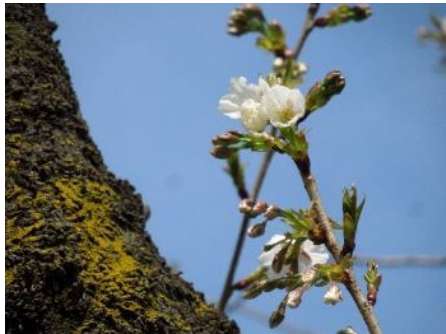
No. 252 (オオシマ系) 開花

昨日の雨が綺麗な青空をもたらし、今日は開花桜が美しく撮れ嬉しい。本日の開花はヤマザクラ4本、オオシマ系8本の計12本。第2ブロックは本日までにソメイヨシノ3本、ヤマザクラ6本、オオシマ系16本、樹種不明1本の計26本が開花したことになる。