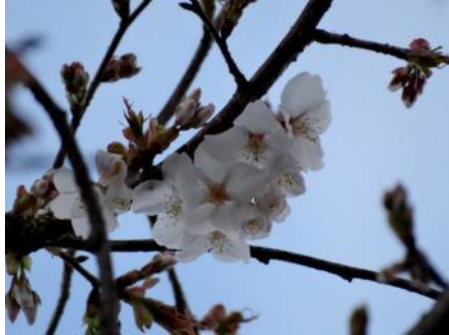
No. 274(カスミザクラ)開花

4月13日はヤマザクラ2本、カスミザクラ4本の計6本の開花を見た。これで第2ブロックはヤマザクラ1本とカスミザクラ7本を残すのみ。ところでNo. 923のヤマザクラは以前カスミザクラではないかと東京農工大学名誉教授(理学博士)福嶋 司先生から桜パトロール中にお目にかかり、ご指摘を受けている。葉柄に毛があり、開花も遅いのでそうかもしれない。樹木医の先生に確認したいと思う。