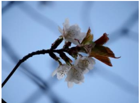
No. 210(カスミザクラ)開花