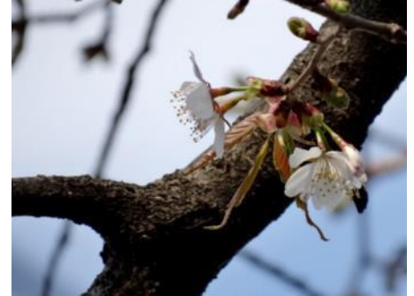
No. 211(カスミザクラ)開花