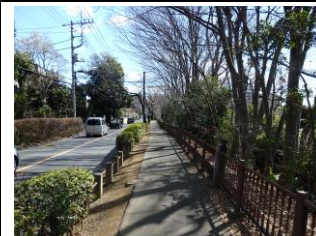
左岸の緑道(菖屋橋付近)