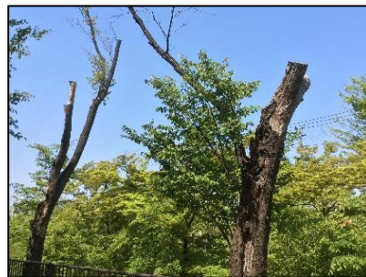
722(加ミザク)、720(加ミザク)