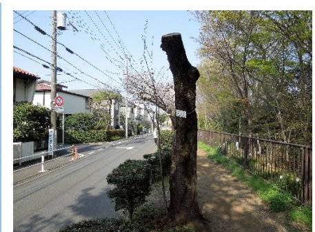
No. 923 ヤマザクラ

No. 923 は以前に東京農工大学名誉教授(理学博士)福嶋 司先生から桜パトロール中にカスミザクラだと指摘された桜樹で、痛みも激しく根元から出た若木でやっともっている感がある。それでも昨年は4月13日に花を付けている。今年も頑張って開花することを祈っている。。