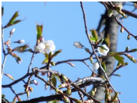
No. 211 カスミザクラ