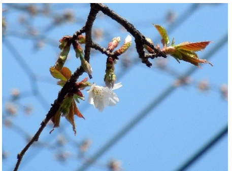
No. 210 カスミザクラ