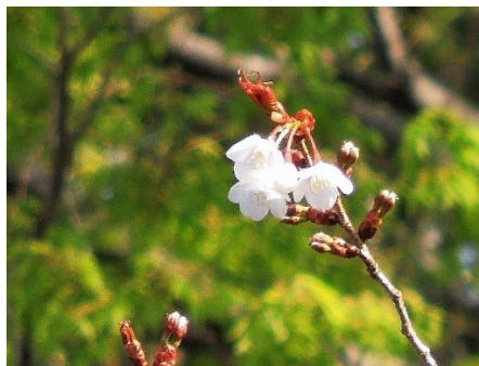
No. 905 ヤマザクラ