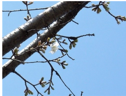
No. 274 カスミザクラ