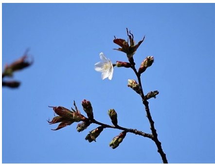
No. 220 カスミザクラ