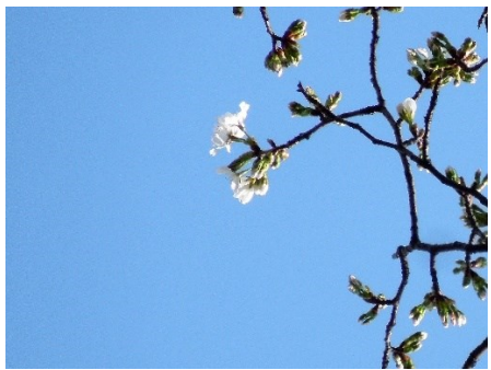
No. 187 カスミザクラ