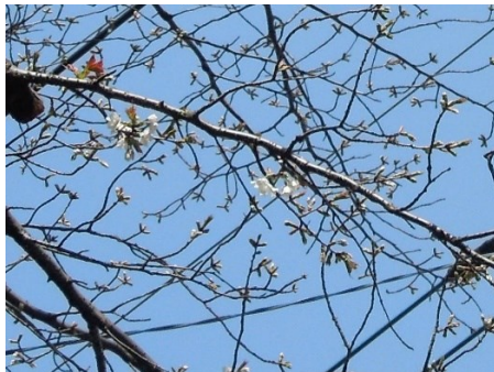
No. 254 カスミザクラ