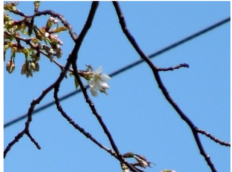
No. 241 カスミザクラ