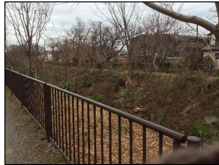
N39 付近 雑木伐採&剪定

右岸；S5 枯死のまま。667(カミザク)枯死。707(カミザク)、714(カミザク) 枯死寸前。 720(カミザク)、722(カミザク)枯死寸前。752 枯死のまま。