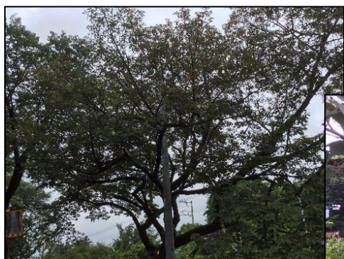
690 材マ サクラ木 多し