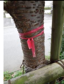
小金井橋の植樹記念樹 北上からの桜苗木 ずいぶん大きくなりましたね。