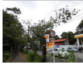
No.181 梢をバツサリ刈られた