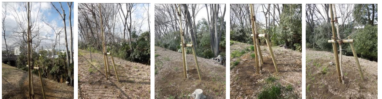
⑳ ⑑ ⑒ ⑓ ⑔

補植された桜樹は概ね順調。茜屋橋から小金井橋に向けて写真撮影する（番号は 25 年度の補植計画表の番号を使用、茜屋橋に最も近いのが⑳、小金井橋に向けて番号が小さくなる）