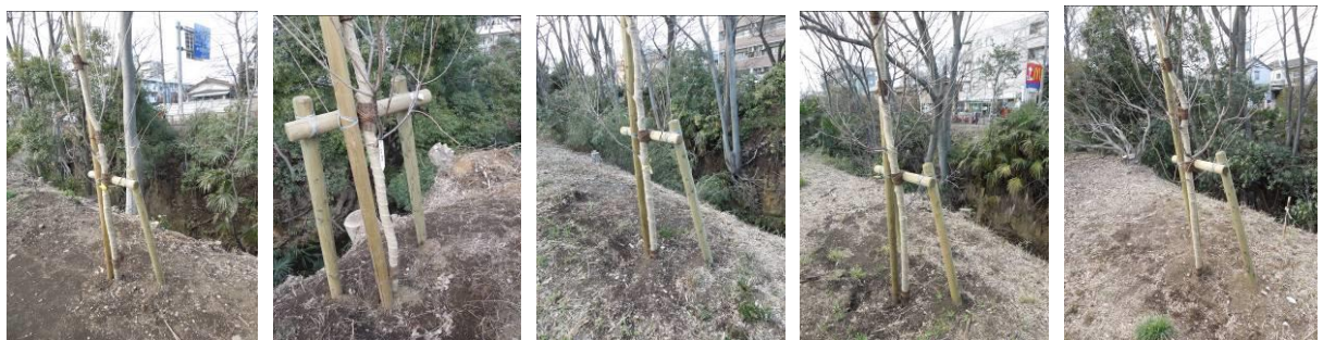
⑕ ⑖ ⑗ ⑘ ⑙