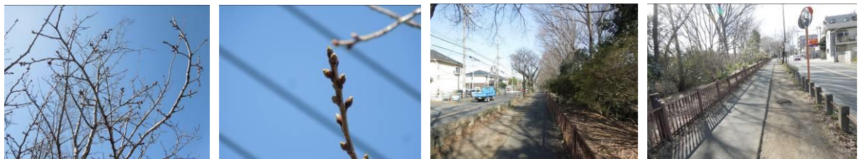
小金井橋記念樹三吉野花芽 早咲き No.273 の固い芽 小金井橋~貫井橋の間で貫井橋の寂しい東側

番号札の無くなった桜樹・・ No.274、No.221、No.214、No.952、No.884