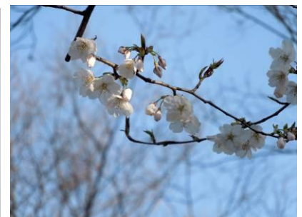
3/28 の No.119