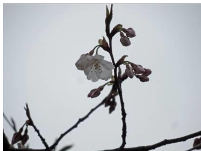
3/27 開花の No.119(ウスゲヤマザクラ)①