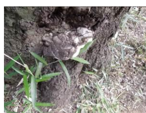
No.955 のコフキサルノコシカケ