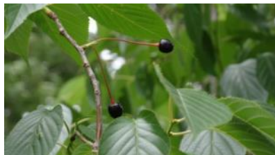
K S 13(ヤマザクラ)

桜の実は熟して地に落ちた木もあるが殆どはまだ青い実の方が多いように見えた。その中で若木に実がついていてとても嬉しかった。