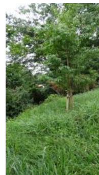
KS 8 西