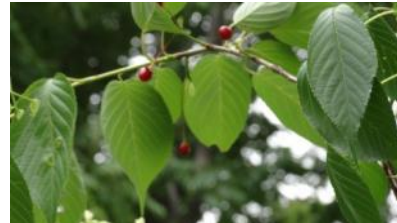
K S 13(ヤマザクラ)