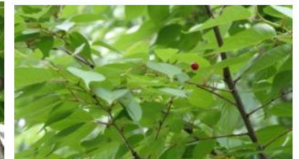
K S 20(ヤマザクラ)