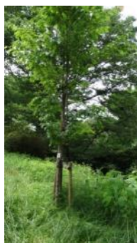
KS 7 東