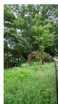
KS 7 西