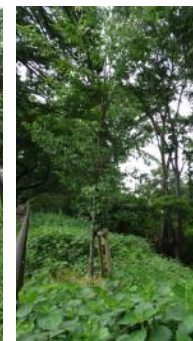
KS 9 東