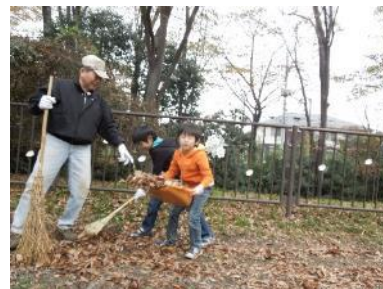
可愛い子供さんも一緒に