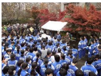
2014年落ち葉回収作戦開会式