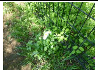
緑道の花 ハルジオン