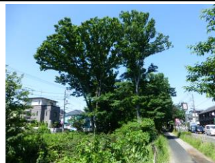
茜屋橋より上流方向 左岸