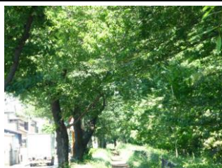
茜屋橋より上流方向 右岸