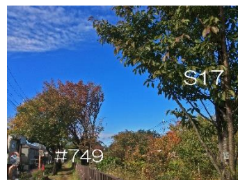
S17は緑葉多いが、#749（加サワ）は紅葉