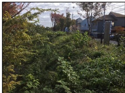
新小金井橋下流右岸

左岸・右岸共に下草が繁茂。一方雑木の伐採識別赤テープ表示あり。 紅葉が始まり美しい桜樹がある。