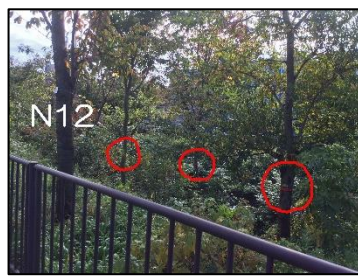
N12 付近 赤テープ多し