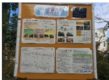
平右衛門橋右岸の表示