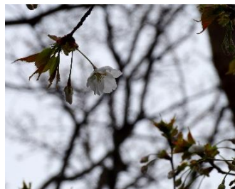
No. 204(オオシマ系)一輪開花