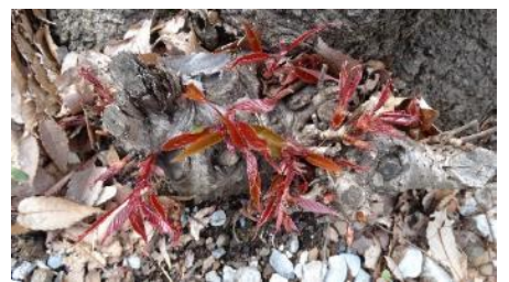
No. 896 (ヤマザクラ) 赤芽