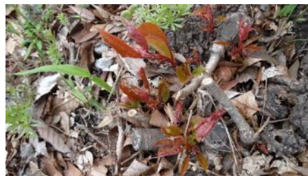
No. 914 (ヤマザクラ) 赤芽