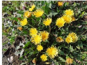
緑道の関東タンポポ