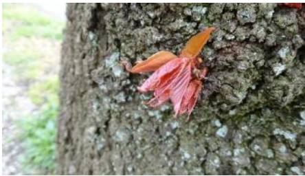
No. 915 (ヤマザクラ) 赤芽