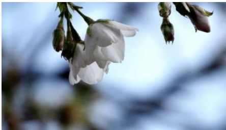
No. 880 4・5 輪目 開花

昨日から気温が上がらず、本日新しく開花した桜樹は無し。風で散った No. 880 の一番花 3 輪に続いて 4・5 輪目が咲いていたのが嬉しかった。ヤマザクラの赤芽が美しい。