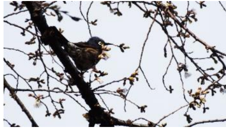
No. 199 に小鳥