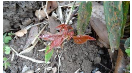
No. 956 (ヤマザクラ) 赤芽