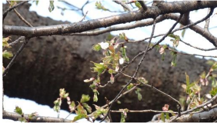
No. 204(オオシマ系)一輪開花