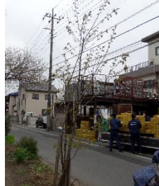
KS9の前の緑道に有志の植えた桜が開花