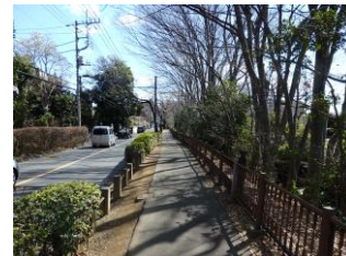
左岸の緑道(菝屋橋付近)