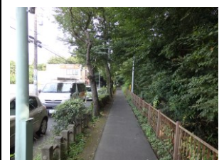
左岸の緑道喜平橋付近