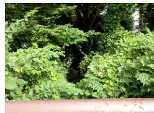
喜平橋橋上より水路