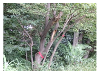
赤テープが巻かれた樹木