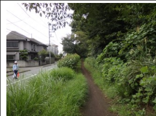
右岸の緑道（小桜橋付近）