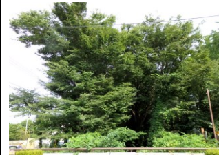
喜平橋橋上より上空