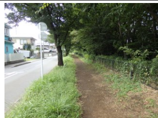
右岸茜屋橋付近の緑道