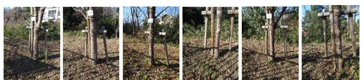
KS7 KS8 KS9 KS10 KS11 KS12

第2ブロックの補植樹14本(KS7~KS20)も順調に成長を続けている。根元が綺麗に刈られて冬陽が優しくあっていた。No211の枝にキノコがビッシリ生えているのが目立った。