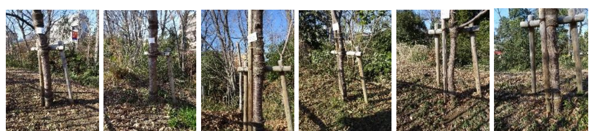
KS13 KS14 KS15 KS16 KS17 KS18