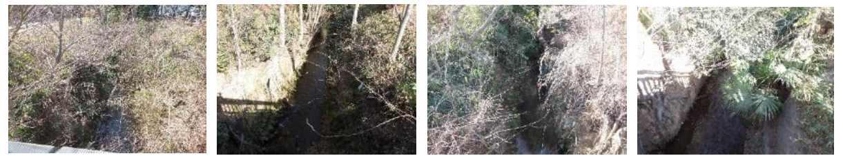
小金井橋西 貫井橋東 貫井橋西 茜屋橋東

冬枯れで草花は両岸とも水仙をチラホラ見るのみで寂しかったが、あと1か月もすれば桜のシーズン到来となる。寒さに耐えることが次のステップにつながるがその息吹を我々は桜樹に見る。久しぶりに見たせいか北岸の小金井橋→行幸松→海岸寺前の並木の抜本的な補植対策が必要だと痛感した。南岸の樋口荘前の果樹園が分譲住宅になりつつある。小金井も緑地が宅地に急速に変わって行く。