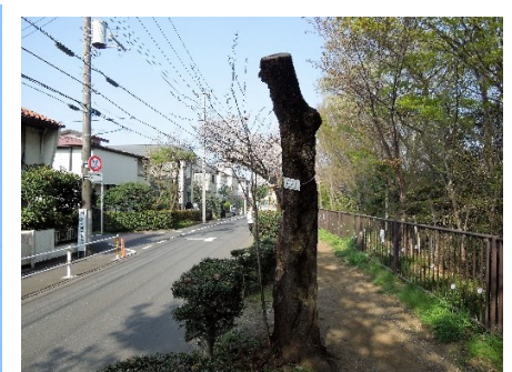
No. 923 ヤマザクラ

No. 923 は以前に東京農工大学名誉教授(理学博士)福嶋 司先生から桜パトロール中にカスミザクラだと指摘された桜樹で、痛みも激しく根元から出た若木でやっともっている感がある。それでも昨年は4月13日に花を付けている。今年も頑張って開花することを祈っている。。